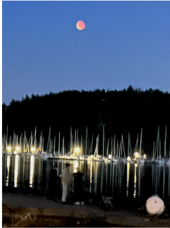
Röd måne över Lilla Värtan och Lappkärrsberget den 7 september 2025.