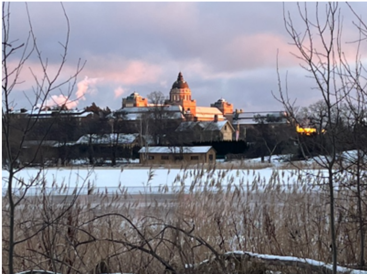
Naturhistoriska Riksmuseet från ett av promenadstråken en kullen vinterdag.

I Södra Bergshamra bor drygt 3000 personer. Andelen med utländsk härkomst (utrikes födda plus födda i Sverige som har bägge föräldrarna födda i utlandet) är lägre än i övriga Solna, men högre än i Sverige som helhet. Invånarna i Bergshamra har samtidigt den genomsnittligt högsta utbildningsnivån bland Solna kommuns stadsdelar. Detta torde bero på den höga andelen studenter och närheten till stora akademiska institutioner som Stockholms universitet, Kungliga Tekniska Högskolan (KTH) och Karolinska Institutet. Södra Bergshamra är också ett omvitnat lugnt område, där man kan gå ut på promenad sena kvällar utan att känna sig osäker.